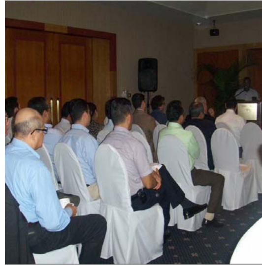
Fotografías tomadas por Ronie Zamor Ridoré, durante el taller de intercambio de experiencias sobre el tema de la transformación de las ONG's de Microfinanzas a Financiera Mercantil regulada, el día 11 de diciembre en el Hotel Crowme Plaza de Managua